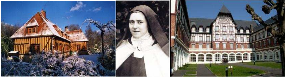
Les Hôtels de Charme Symboles de France à proximité de Lisieux: