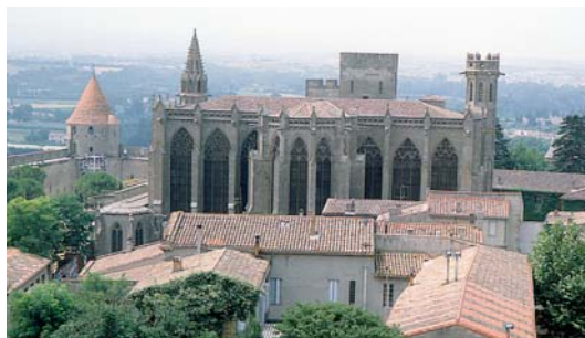
La basilique Saint-Nazaire