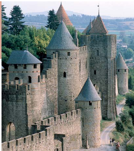
De puissantes fortifications ceinturent la cité