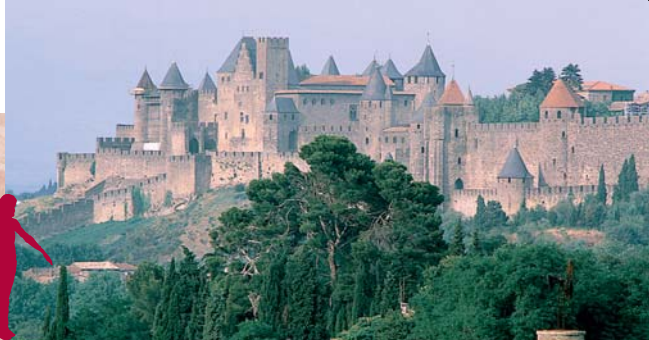
Un site classé au patrimoine mondial